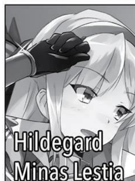
Hildegard Minas Lestia

Una de las prometidas de Touya. Antigua Matriarca del Clan de las Hadas, ahora se desempeña como Maga de la Corte de Brunhild. Ella dice tener seiscientos doce años, pero se ve extremadamente joven. Puede manejar todos los elementos mágicos excepto Oscuridad, lo que significa que su habilidad mágica es la de un genio. Leen es una especie de matón despreocupado.