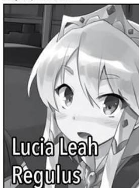
Lucia Leah Regulus

Una de las prometidas de Touya. Tenía diez años en su aparición inicial. Su apodo es Sue. La sobrina del rey de Belfast y la prima de Yumina. Touya la salvó de ser atacada en la carretera. Tiene un espíritu inocentemente aventurero.