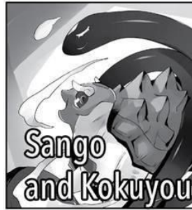
Sango and Kokuyou

La tercera Bestia Celestial convocada por Touya. Ella es la Monarca de la Llama, gobernante de las cosas emplumadas. A pesar de que su apariencia es llamativa y extravagante, en realidad es bastante tranquila y serena.