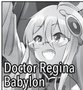
Doctor Regina Babylon

Terminal Gynoid a cargo del Laboratorio de Alquimia. Una de las reliquias de Babilonia. Se llama Flora para abreviar y viste con un traje de enfermera. Su número de serie es el #21. Una enfermera con pechos peligrosamente grandes y medicinas aún más peligrosas.