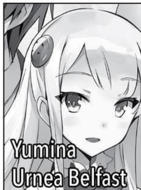
Yumina Urnea Belfast

Una de las prometidas de Touya. La mayor de las hermanas gemelas salvada por Touya hace algún tiempo. Una feroz luchadora cuerpo a cuerpo, utiliza guanteletes en el combate. Su personalidad es bastante directa y contundente. Puede usar la magia de la fortificación Nula, específicamente el hechizo [Boost]. Le encanta la comida picante.