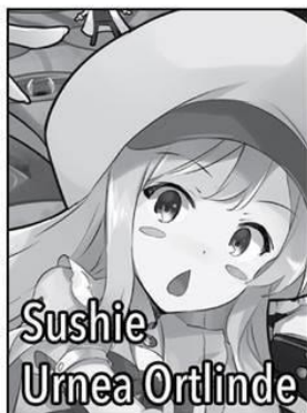
Sushie Urnea Ortlinde

Un estudiante de secundaria que fue asesinado accidentalmente por Dios. Es un tipo sin inconvenientes al que le gusta seguir la corriente. No es muy bueno leyendo la atmósfera, y típicamente toma decisiones precipitadas que le muerden el trasero. Su reserva de maná es ilimitada, puede hacer uso impecable de cada elemento mágico, y puede lanzar cualquier hechizo Nulo que desee. Actualmente es el Gran Duque de Brunhild.