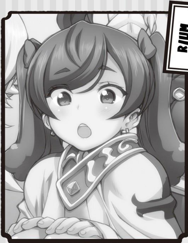
Compañera del grupo de Haruno. Una Maga de Cristal.