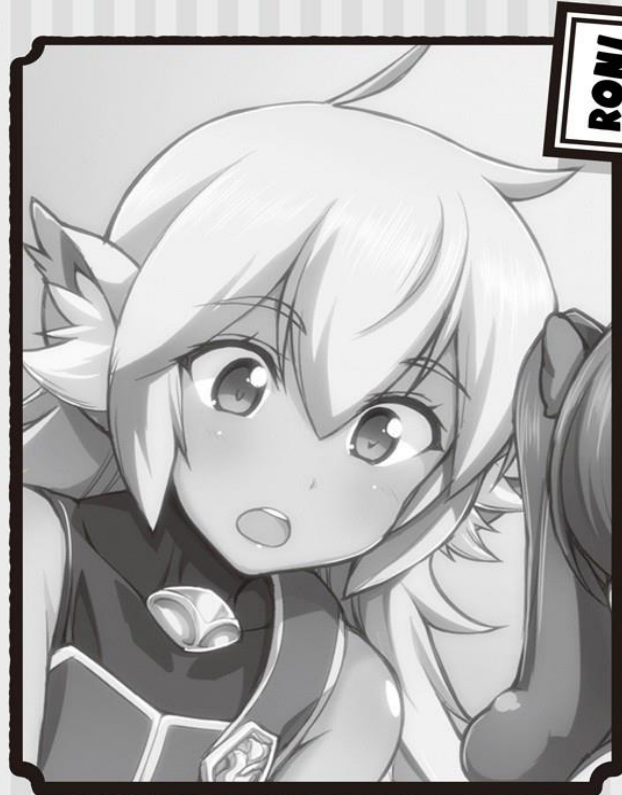
Asistente de Clena. Una licaona, una loba semihumana.